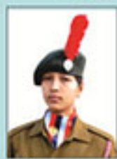
ਐਂਡਰ ਅਫਸਰ ਪੁਜਾ ਰਾਣੀ