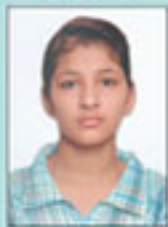
ਸਮਰੀਤੀ B.Com- I