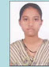
ਨੈਨਾ B.Com- I