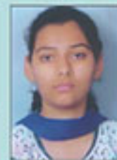
ਕਾਸਲ B.Sc- I